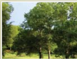
1 Joniškio parkas