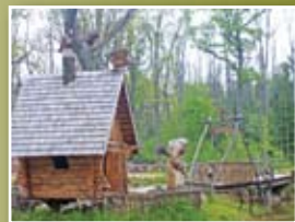
9 Kavinė-motelis „Plūgo broliai“