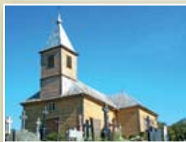
2 Kalnėlio kaimo Šv. Jono Krikštytojo kapinių koplyčia