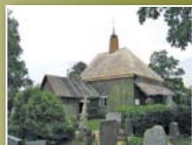
7 Jakiškių koplyčia