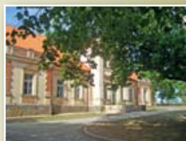
6 Jakiškių dvaras