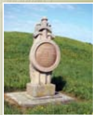
3 Sidabrės piliakalnis